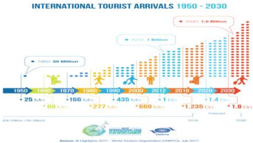
Şəkil 2. Beynəlxalq Turizm Hərəkətləri 1950-2030

1950-ci ildən indiyədək beynəlxalq turizm hərəkətləri şəkildə göstərilir. İştirak edən turistlərin sayı ətraflı göstərilir. 1950-ci ildə 25 milyon nəfər turizm fəaliyyətlərində iştirak edərkən 1960-cı ildə 69 milyon, 1970-ci ildə 166 milyon, 1980-ci ildə 277 milyon, 1990-cı ildə isə 435 milyon insan turizm fəaliyyətində iştirak etmişdir. 2000-ci illərdə bu rəqəm 2012-ci ildə 669 milyon nəfərə çatmışdı, 2017-ci ildə beynəlxalq turizm hərəkətlərində iştirak edənlərin sayı 1 milyard nəfərə yüksəlib. Bu rəqəm 2019-cu ildə 1.5 milyard (ötən dövrlər üzrə +4% artım), 2020-ci ildə bu rəqəm 381 milyon (-74% azalma) müşahidə edilmişdir. Bu azalmanın əsas səbəblərindən biri də COVID-19 pandemiyası olmuşdur [10, 11, 12, 14, 16].