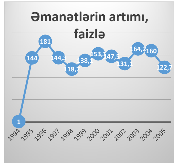
Şəkil 3. Əmanətlərin artımı (faizlə)